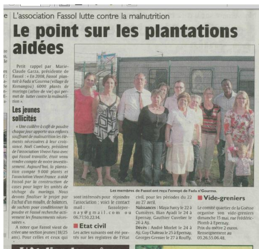
Journal L'Union - article du 13 mai 2011

D'autres projets sont en cours grâce au développement de notre plantation et, surtout, au forage qui permettra d'augmenter ses capacités de production. Parmi ces projets, il y a la création d'un « centre de santé » autour du moringa ainsi que l'extension de la plantation qui permettra au village de vivre de la vente des produits dérivés.